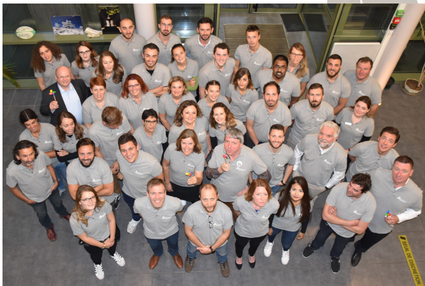
Photo d'équipe lors de l'inauguration du parc éolien de Lacaine (81) le 04 octobre 2019