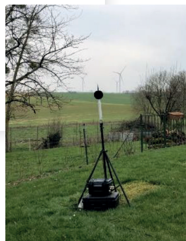
Un sonomètre est un outil indispensable pour les études acoustiques