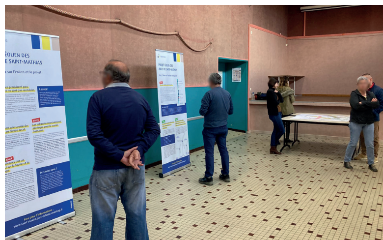
Participants devant les panneaux d'information

« Ça serait bien de pouvoir se rendre compte du bruit des éoliennes. Nous pourrions nous rendre à un parc éolien pour évaluer nous même l'intensité du bruit. »